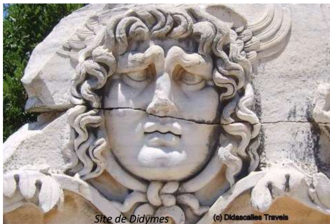
Site de Didymes